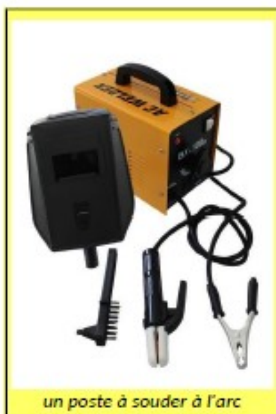
un poste à souder à l'arc