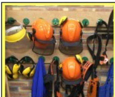
Équipement de Protection Individuelle