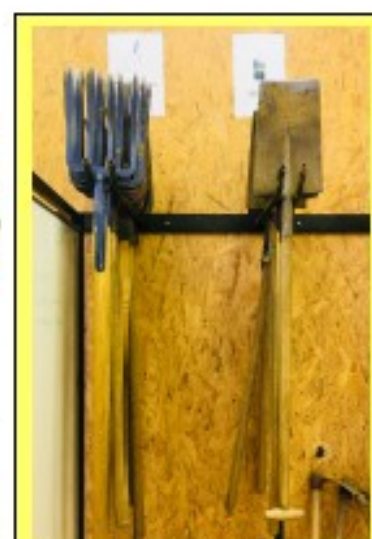
des fourche-bêches et des bêches